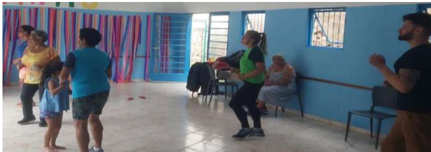
Dança de salão Maringá