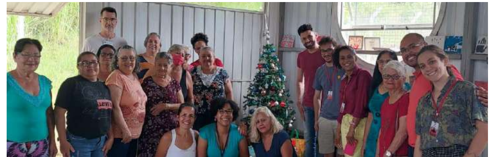
Palestra: Entretenimento,lazer e socialização na velhice