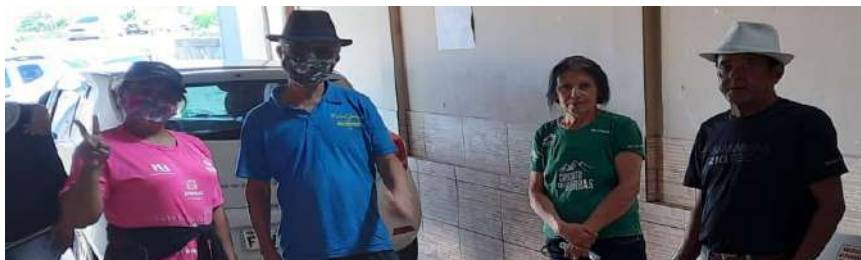
Aula de dança de salão Santa Gertrudes