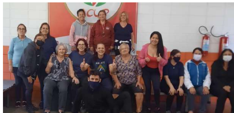
Dança de salão Santa Gertrudes