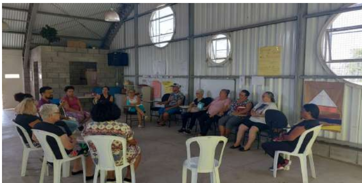
Dança de salão Morada das Vinhas