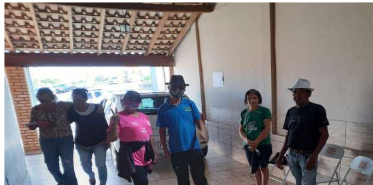
Dança de salão Tamoio