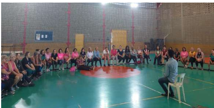
Palestra “saúde mental na velhice” Tamoio