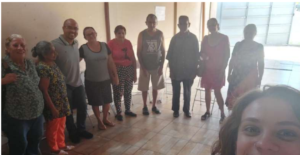
Capacitação Santa Gertrudes